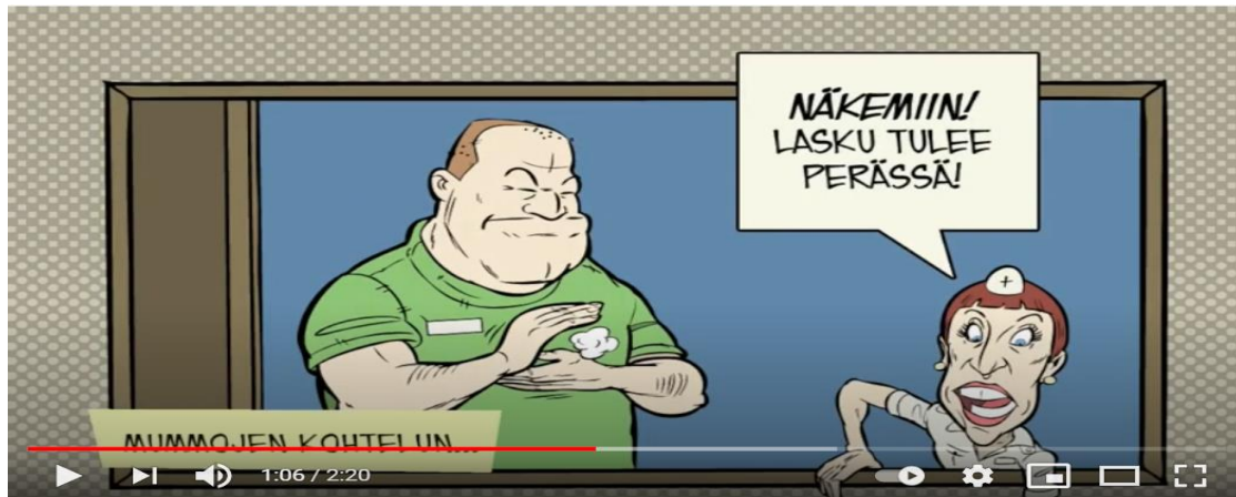
Kuva 1. Kuvakaappaus Perussuomalaisten vuoden 2015 eduskuntavaalien kampanjvideosta ”Sinä olet ratkaisija. Käytä ääntäsi”.